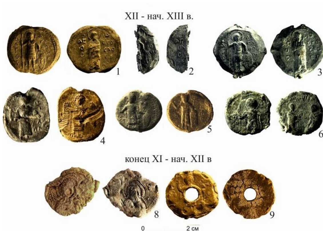
Печати XI - XIII веков.

Документ писали на пергамене, на краю листа особым образом делали отверстия и привязывали шнур. Шнур продевался в канал на заготовке, и специальными инструментами свинцовую заготовку сплющивали. Таким образом, канал зажимался, и печать уже нельзя было снять со шнура – только отрезать. На щипках, которыми зажималась заготовка, было изображение или надпись, оттиск которого оказывался на мягком свинце. Как правило, это могло быть имя того человека, от имени которого был написан документ.