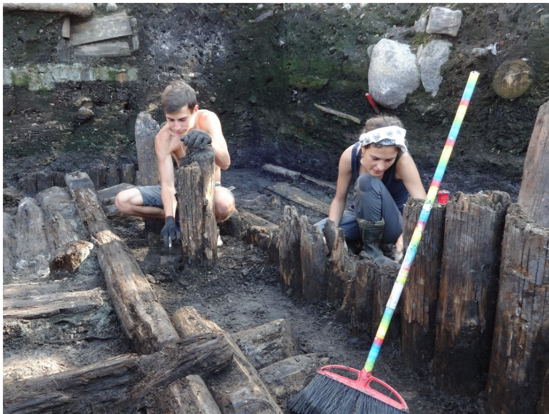
Работы на Знаменском раскопе.

XI-XIV веков и обнаружили большое количество других артефактов. В течение полугода ученые исследовали находки. Результаты полевых исследований, в том числе находок, представлены на XXXIII конференции «Новгород и Новгородская земля. История и археология».