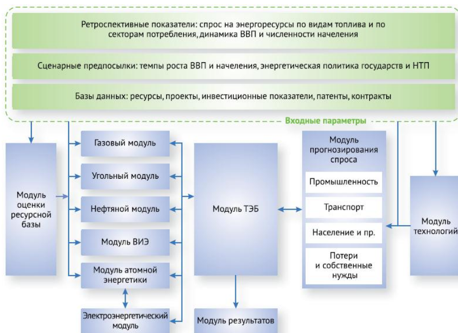
Рисунок 2 – Структура блока прогнозирования мировой энергетики