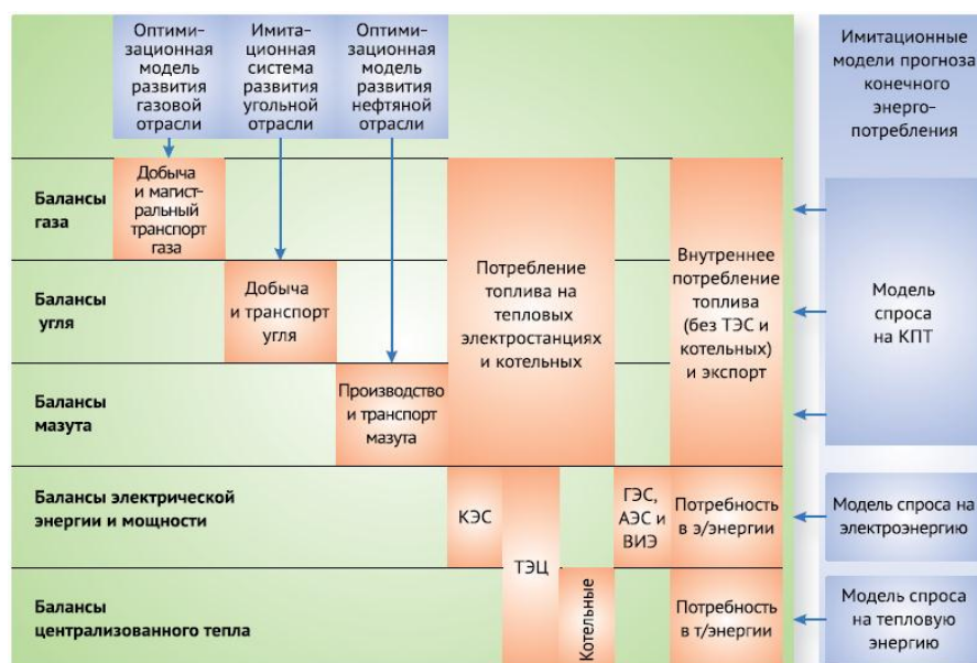
Рисунок 4 – Структура оптимизационной модели развития электроэнергетики в ТЭКе «EPOS»

4). На отраслевом уровне обеспечивается согласование параметров производственных и инвестиционных программ с условиями финансовой устойчивости отраслей ТЭК и крупнейших энергетических компаний через отраслевые и корпоративные финансовые балансы. Для этого в условиях неопределенности ситуации на внутренних и внешних энергетических рынках и рынках капитала моделируются денежные потоки от операционной, инвестиционной, финансовой деятельности крупнейших газовых, нефтяных, электроэнергетических компаний России. В результате оценивается возможность реализации долгосрочных инвестиционных программ субъектами ТЭКа за счет собственных и привлеченных ресурсов, роста их капитализации, а также эффективность и масштабы изменений в ценовой, налоговой, кредитной политике государства.